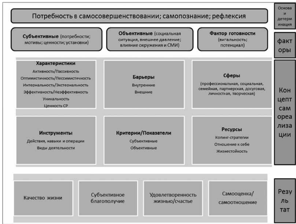
Рис. 2. Схема конструкта самореализации

вали их в пары дихотомических определений, внося, однако, некоторые дополнения в соответствии с выделенными параметрами. Сферы самореализации нами несколько дополнены относительно существующих теорий, поскольку на основании многолетних исследований мы считаем целесообразным разделять отношения с партнером и детьми, родителями/родственниками, учитывая то, что степень самореализации в каждом из этих аспектов может быть различной. Мы считаем необходимым ввести в модель операциональный конструкт «инструменты самореализации» для обозначения тех способов, которые субъект избирает как приемлемые для себя в процессе реализации собственного потенциала. К ним относятся действия, навыки и операции, виды деятельности, общение, отношение. Важным в модели является наличие барьеров, то есть препятствий на пути реализации потенциала субъекта. Выделены внешние (преимущественно социальные препятствия, жизненные обстоятельства, средовые факторы и т. п.) и внутренние (преимущественно психологического плана) барьеры. Важным с нашей точки зрения является выделение ресурсов самореализации, то есть психологических образований (и внешних характеристик), на которые субъект мог бы опираться для осуществления желаемого процесса. К ним мы относим копинг-стратегии (как вариант способов преодоления стресса в процессе жизнедеятельности), витальность (как некий энергетический потенциал субъекта, который может быть направлен на необхо-