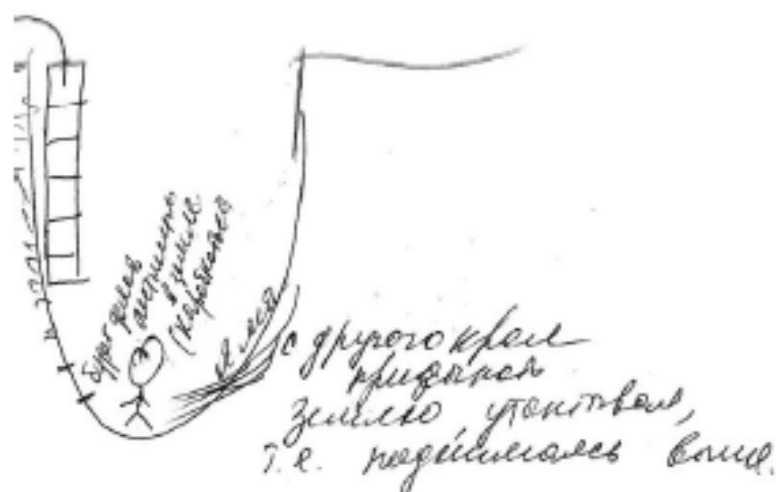
Рис. 1. Самостоятельное преодоление препятствия

В отличие от вербальных описаний в изобразительных метафорах ситуация не всегда предстает как однозначная и конкретная, зачастую появляются более глобальные проблемы: безработица, природные катаклизмы, разрушения, сиротство. Так, например, те молодые люди, которые связывают ТЖС с обязательным ее решением, преодолением, изображают человечков в ямах, тупиках, лабиринтах, пытающихся найти способ выбраться из данного положения – где-то самостоятельно (рис. 1), где-то с помощью других людей (рис. 2).